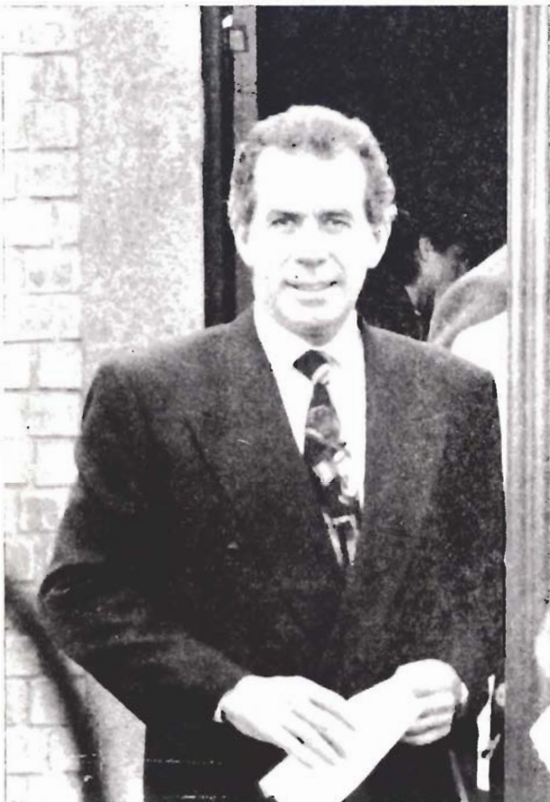
RICARDO BELMONT CASSINELLI Alcalde de Lima Metropolitana

Este Plan nos ha de permitir unificar conceptos, concurrir con iniciativas públicas y privadas hacia los mismos objetivos, concertar nuestros programas de inversiones, y, sobre todo, fortalecer nuestras bases de solidaridad social, al posibilitarnos identificar los proyectos prioritarios que vayan haciendo de esta ciudad una mejor Metrópoli en el siglo XXI.